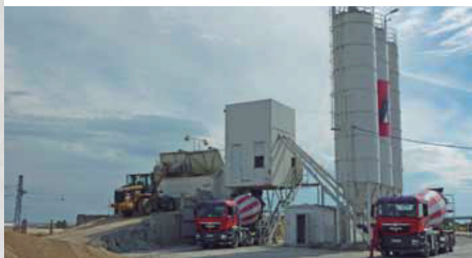
Planta de dosificación