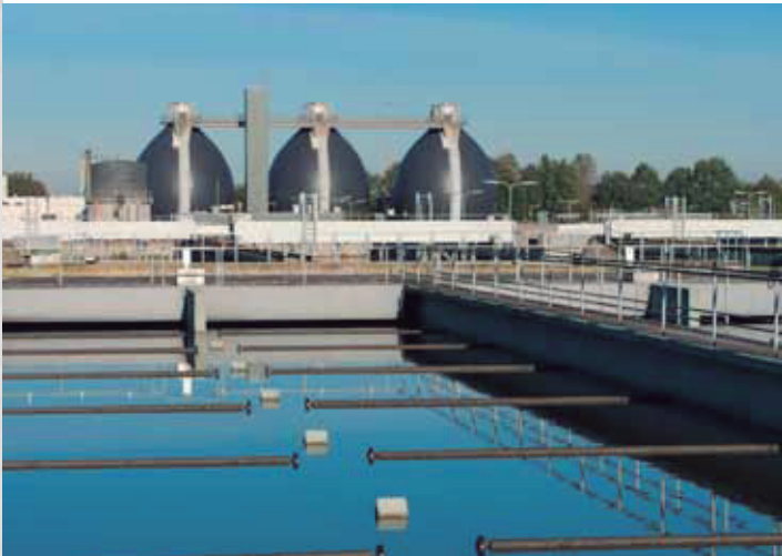
Instalaciones de tratamiento de residuos