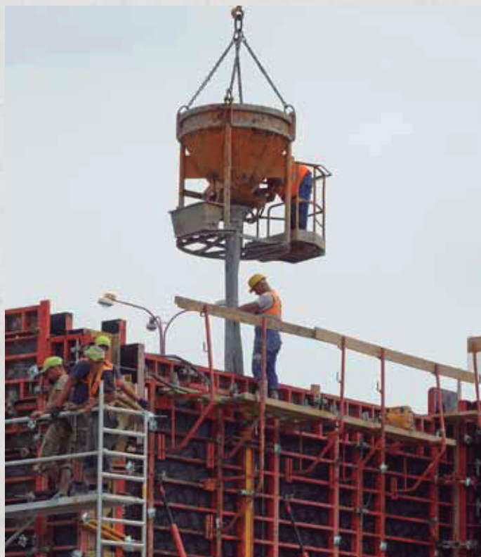
Vertido de hormigón