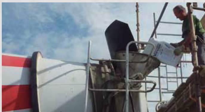
Incorporación de VANDEX AM 10 en la planta de dosificación

Para confirmar el rendimiento del hormigón, las mezclas de prueba deben realizarse bajo condiciones del proyecto.