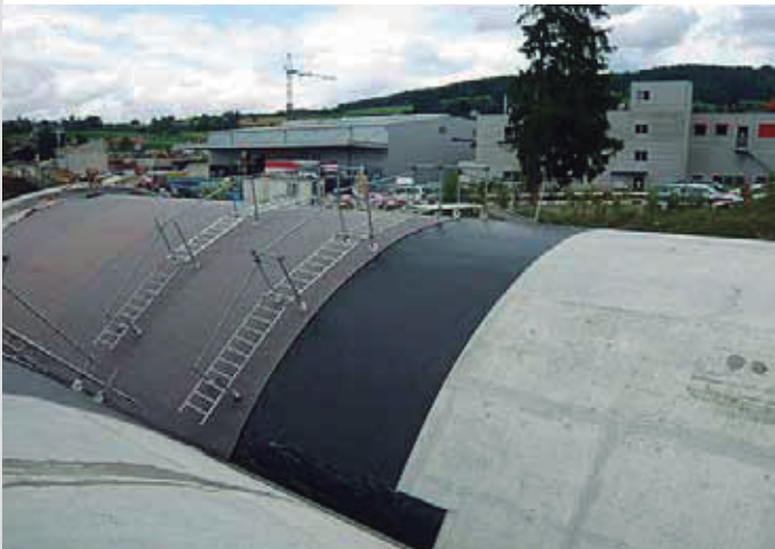
Metros y subterráneos