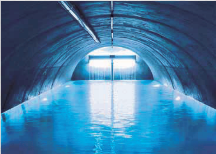
Estructuras de contención de agua