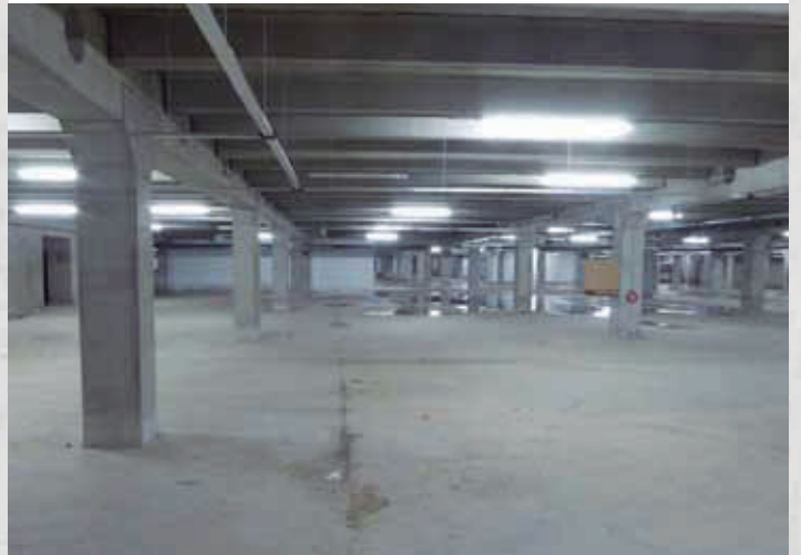
Cimientos y bases